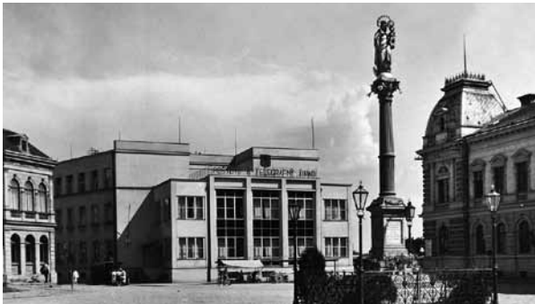
Pohľad z námestia na budovu Poštového a telegrafného úradu v 30-tych rokoch 20. storočia.

Vnútornú, administratívnu a technickú časť prevádzky pošty situoval do dvoch dvoji-