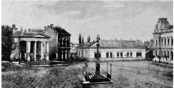
Námestie na začiatku 20-tych rokov 20. storočia. Na mieste prízemných domov za mariánskym stĺpom bola neskôr postavená budova Poštového a telegrafného úradu. Vľavo budova divadla, vpravo severné krídlo vtedajšej radnice.