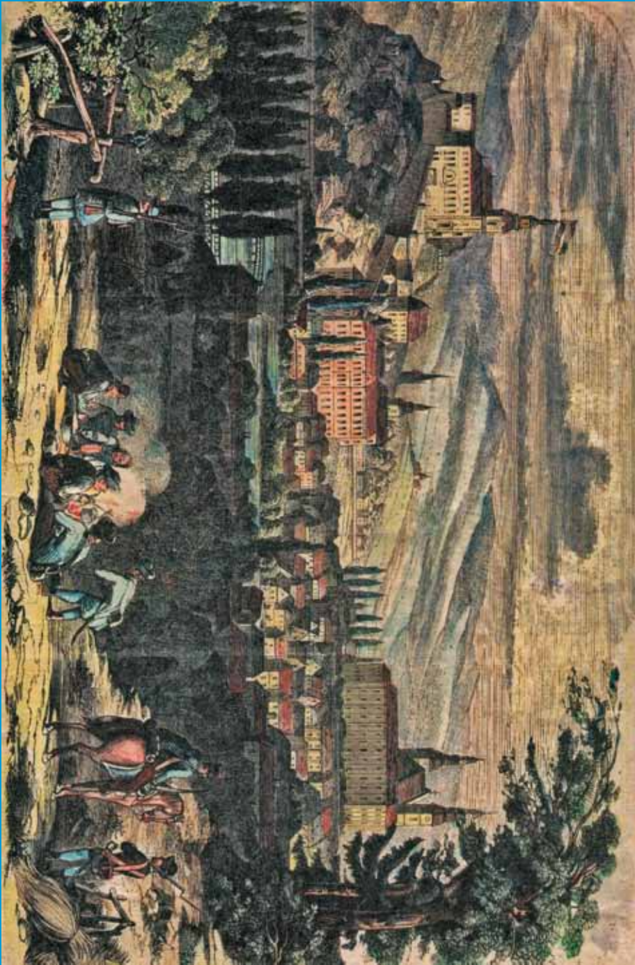
Medirytina od neznámeho autora. Klasicistická veduta Nitry vznikla v rokoch 1848-1849. Zobrazuje oddychujúce hurbanovské vojská pri Nitre.